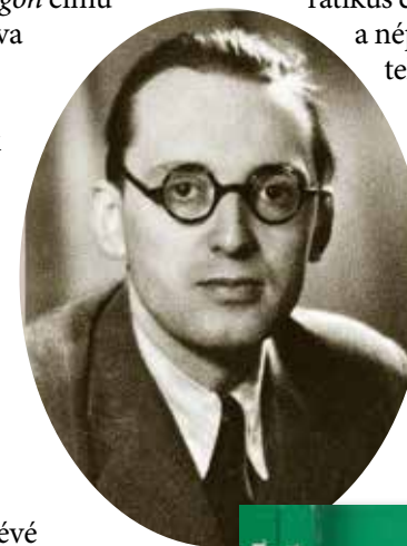
Bibó István 1935 körül, valamint a széles körű értelmiségi összmunkával készült, 1980-ban végül szamizdatként megjelent Bibó-émlékkönyv rendszer-váltás utáni legális kiadása

lódó demokratikus ellenzéki mozgalom különféle akcióiban. Ugyanakkor fontosnak tartotta, hogy az egymástól különböző, de összességében is még gyenge ellenzéki táborokat ne tudja megosztani, egymás ellen kijátszani a hatalom, ezért az együttműködés megteremtése volt a célja, a „népfrontos” szervezkedési tapasztalatainak átadása. Integratív személyiséggé tudott válni, aki nemcsak a demokratikus ellenzék, hanem a magát a népi mozgalom örökösének tekintő nép-nemzeti irányzat képviselőivel is jó viszonyt ápolt. Ideológiai téren a két csoport között helyezkedett el. A képviseleti